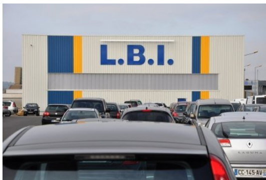
LBI investit lourdement

« Les Bronzes d'Industrie » s'épellent et s'appellent en effet LBI , et derrière ces trois lettres magiques, une PMI familiale demeure seule maintenant à afficher son activité de base, à savoir, la métallurgie des alliages cuivreux coulés et centrifugés horizontalement et verticalement.